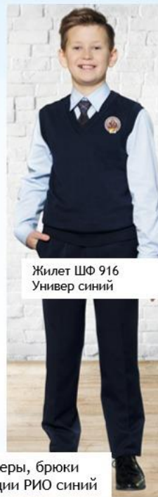
Жилет ШФ 916 Универ синий