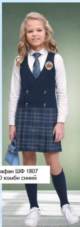
Сарафан ШФ 1807 РИО комби синий