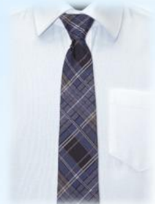
Галстук 033/208 - 35 см